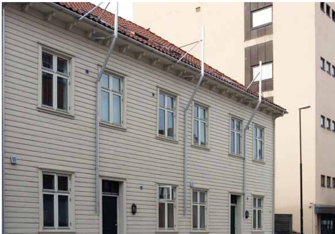
Modum gesimsstiger montert fra takvindu i bygård.