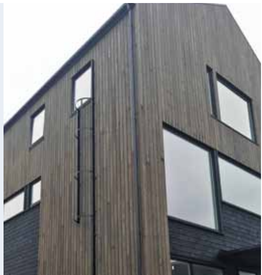
Modum utfellbar ryggvernstige.

Modumstigen fås i alle farger, men lagerføres aluminium, sort og hvitt.