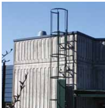
Inspektionsstige med ryggvern.