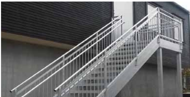
Vi leverer og monterer spesialtilpassede rømningsstrapper.